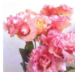
ボヤージュ アプリコット