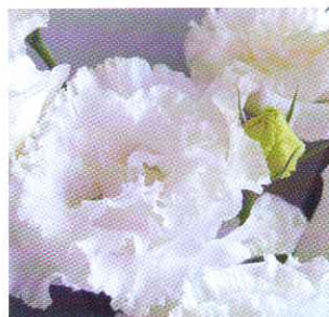
ボヤージュ ホワイト

近年、全国的に高い人気があり、花束やアレンジメント用として、人気が出ているお花です！！