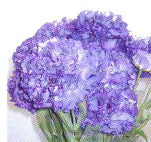
ボヤージュ ブルー