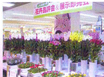
生産者の技術を競い合う品評会

また、従来からあるセンニチコウや、トルコギキョウの一部で生産者育種によるオリジナル品種による生産も行われています。